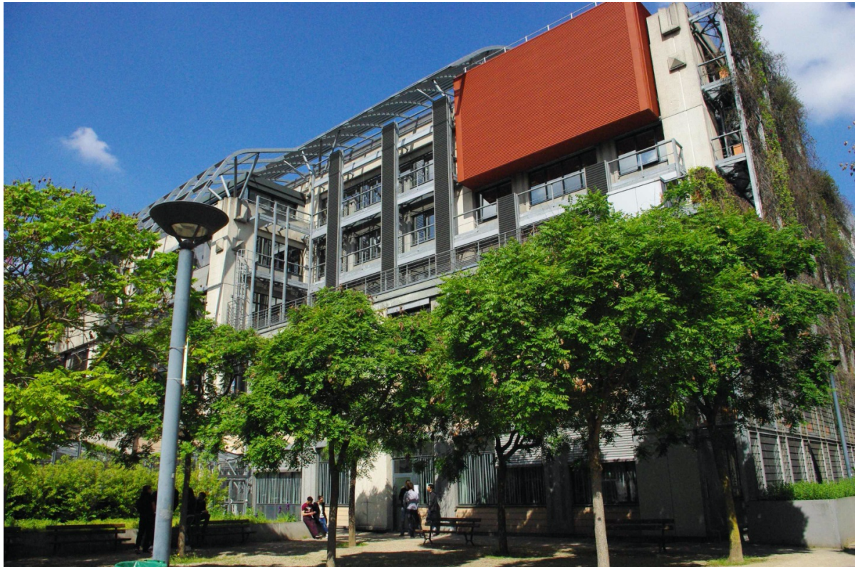
IAE Paris-Sorbonne Business School